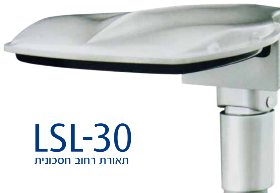
LSL-30 תאורת רחוב חסכונית